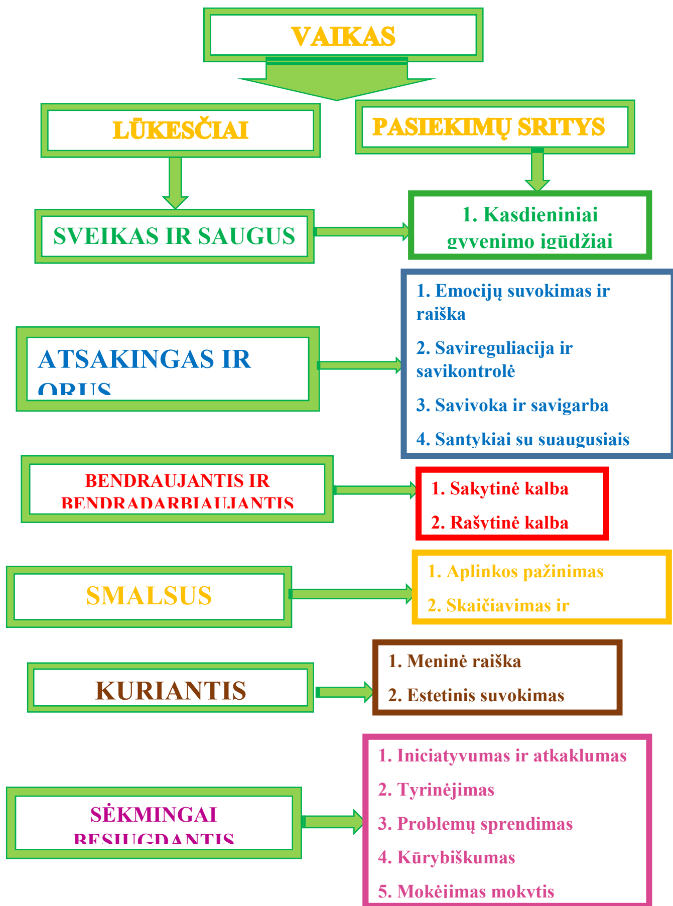
1 pav. Vaikų pasiekimų sričių jungimas į grupes pagal ikimokyklinio ugdymo(si) lūkesčius.